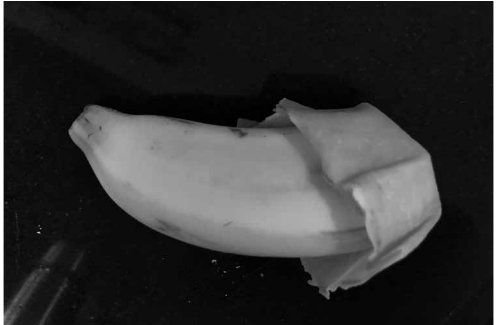
Früher eine gängige Art: Lebensmittel mit Wachstüchern zu verpacken.

ben. In einem Umluftbackofen schmilzt das Bienenwachs innerhalb einer Minute.