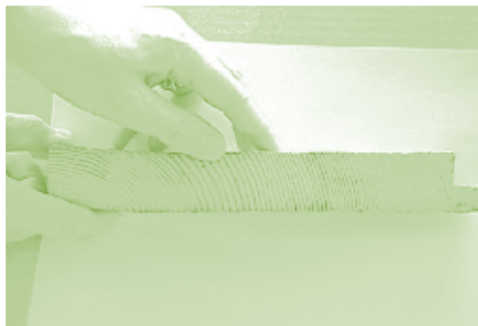
Holzprobe aus einer Hauswand mit vielen Jahrringen.

lichkeit einer Datierung. Denn es ist unwahrscheinlich, dass sich eine längere Abfolge von Jahrringbreiten genau gleich wiederholt.